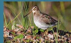
Becasina Común / Common Snipe Gallinago gallinago 23 cm-Frecuente y Residente