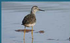
Pitotoy chico / Lesser Yellowlegs Tringa flavipes 23 cm-Abundante y Migratoria Neártica (Mapa A)