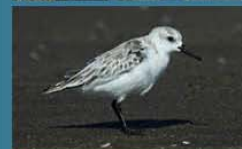
Playerito Blanco / Sanderling Calidris alba 17 cm-Común y Migratoria Neártica (Mapa A)