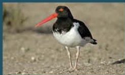
Ostrero Pardo / American Oystercatcher Haematopus palliatus durnfordi 35 cm-Abundante y Residente