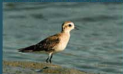
Chorlo Pampa / American Golden Plover Pluvialis dominica 22 cm-Común y Migratoria Neártica (Mapa A)