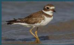
Chorlito Palmado / Semipalmated Plover Charadrius semipalmatus 14 cm-Frecuente y Migratoria Neártica (Mapa A)