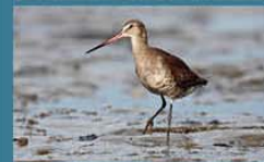
Becasa de Mar / Hudsonian Godwit Limosa haemastica 33 cm-Abundante y Migratoria Neártica (Mapa A)