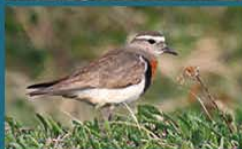
Chorlito Pecho Canela / Rufous-Chested Dotterel Charadrius modestus 18 cm-Frecuente y Migratoria Patagónica (Mapa B)