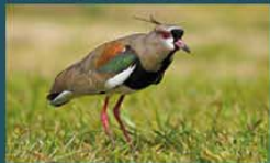
Tero Común / Southern Lapwing Vanellus chilensis 31 cm-Común y Residente