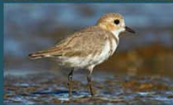
Chorlito Doble Collar / Two-Banded Plover Charadrius falklandicus 16 cm-Abundante y Migratoria Patagónica (Mapa B)