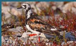
Vuelvepiedras / Ruddy Turnstone Arenaria interpres 21 cm-Rara y Migratoria Neártica (Mapa A)