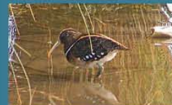
Aguatero / South American Painted-Snipe Nycticryphes semicollaris 17 cm-Rara y Residente