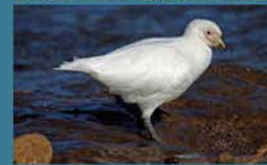
Paloma-Antártica / Snowy Shearwater Chionis alba 35 cm-Frecuente y migratoria de la Antártida