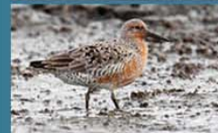
Playero Rojizo / Red Knot Calidris canutus rufa 22 cm-Común y Migratoria Neártica (Mapa A)