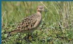
Playerito Canela / Buff-Breasted Sandpiper Tryngites subruficollis 17 cm-Rara y Migratoria Neártica (Mapa A)