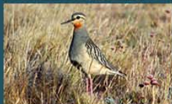
Chorlo Cabezón / Tawny-Throated Dotterel Oreophotus ruficollis 25 cm-Frecuente y Migratoria Patagónica (Mapa B)