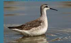
Falaropo Común / Wilson's Phalarope Phalaropus tricolor 18 cm-Rara y Migratoria Neártica (Mapa A)