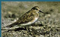
Playerito Unicolor / Baird's Sandpiper Calidris bairdii 15 cm-Frecuente y Migratoria Neártica (Mapa A)