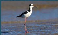
Tero-Real / South American Stilt Himantopus melanurus 34 cm-Abundante y Residente