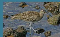
Playero Trinador / Whimbrel Numenius phaeopus 36 cm-Frecuente y Migratoria Neártica (Mapa A)