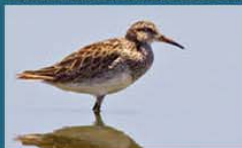
Playerito Pectoral / Pectoral Sandpiper Calidris melanotos 18 cm-Rara y Migratoria Neártica (Mapa A)