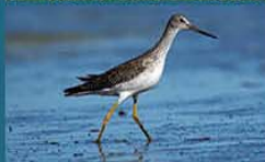
Pitotoy Grande / Gerater Yellowlegs Tringa melanoleuca 29 cm-Frecuente y Migratoria Neártica (Mapa A)