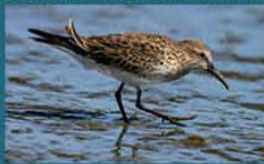
Playerito Rabadilla Blanca / White-Rumped Sandpiper Calidris fuscicollis 15 cm-Abundante y Migratoria Neártica (Mapa A)