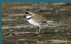
Chorlito de collar / Collared Plover Charadrius collaris 13 cm-Frecuente y Migratoria Patagónica (Mapa B)