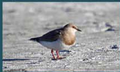
Chorlito Ceniciento / Magellanic Plover Pluvianellus socialis 18 cm-Rara y Migratoria Patagónica (Mapa B)